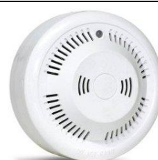
GD-983-CO - detekce CO