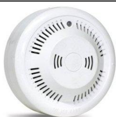
GD-983-LP - propan